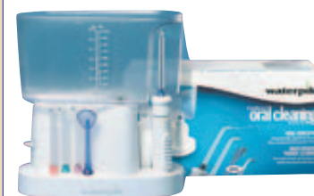
Waterpik® Familien-Munddusche WP-70 E

Neue Studie: Wirksame Prävention gegen Periimplantitis mit Munddusche von Waterpik®